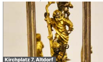
Kirchplatz 7, Altdorf

Eine Darstellung der Geschichte des russischen Generals Suworow und seines Feldzugs über die Alpen und durch Uri.