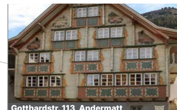
Gotthardstr. 113, Andermatt