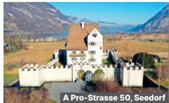
A Pro-Strasse 50, Seedorf

Schloss A Pro Die schönsten Mineralien der kantonalen Sammlung – direkt aus den Tunneln unter dem Gotthard.