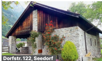
Dorfstr. 122, Seedorf

Eine Ausstellung mit den schönsten Mineralienfunden der ganzen Schweiz – präsentiert in einem historischen Gebäude.