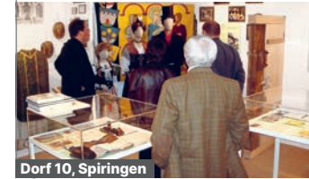
Dorf 10, Spiringen

Das Museum über Spiringen und den Urnerboden mit wertvollen Gegenständen von 1196 bis zur Neuzeit.