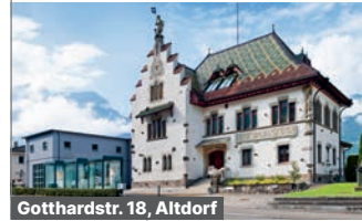
Gotthardstr. 18, Altdorf

Die umfassendste Sammlung zur Urner Geschichte – von den keltischen Goldringen bis zur Postkutsche.