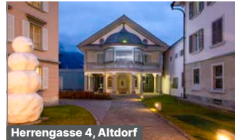
Herrengasse 4, Altdorf

Schloss A Pro Die schönsten Mineralien der kantonalen Sammlung – direkt aus den Tunneln unter dem Gotthard.