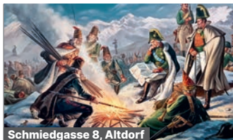
Schmiedgasse 8, Altdorf

Eine naturwissenschaftliche Sammlung zu Geologie, Flora und Fauna der Alpenwelt – und darüber hinaus.