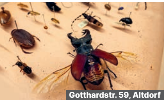
Gotthardstr. 59, Altdorf